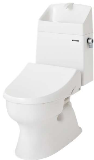
温水洗浄便座タイプ 樹脂製タンク