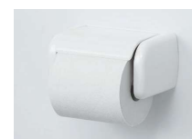
ワンタッチ式紙巻器 ワンタッチカミマキKT BW1