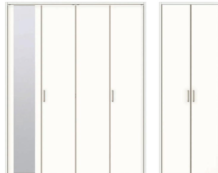
LAA (折れ戸・ミラー付)