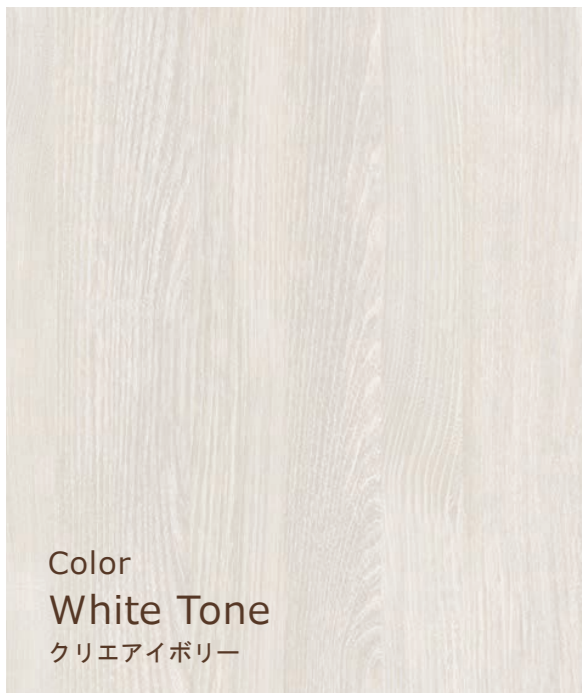
Color White Tone クリエイボリー