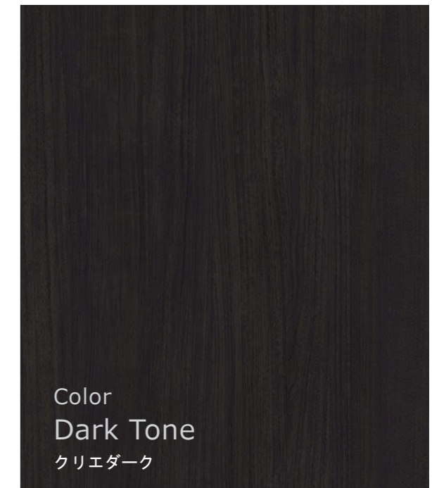
Color Dark Tone クリエダーク