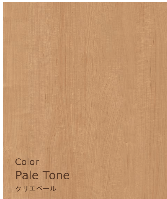
Color Pale Tone クリエパール