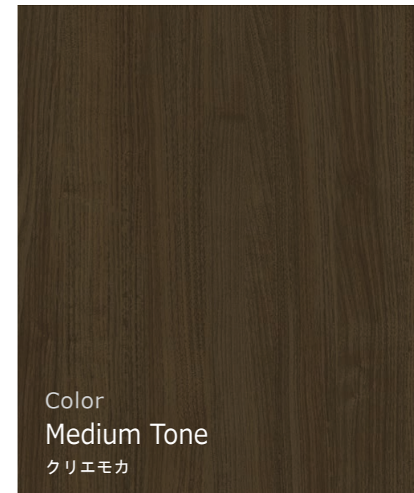
Color Medium Tone クリエモカ