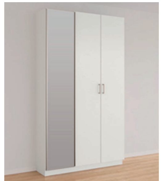
LAA (H21・D36・W12プラン・ロッカー型・ミラー付)

※ミラーはLDK及び和室を除く居室最大2ヶ所までとさせていただきます。※ミラー扉の位置は一番左端のみとなります。