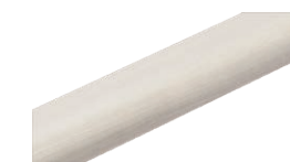
プレシヤスホワイト