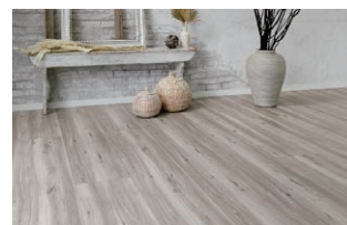
DC/ グレージュエルム F (さらっと Foot feel)