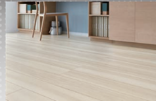
D1/ イタリアンウォルナットF (ほんのり Foot feel)