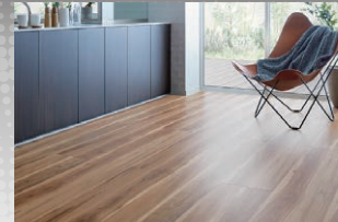
D3/ ライトメープルF (さらっと Foot feel)