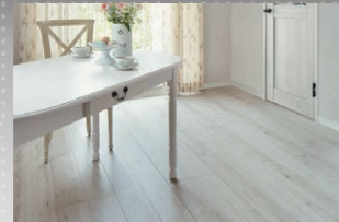
DJ/ ホワイトオークF (ほんのり Foot feel)