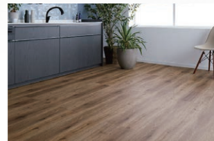
DK/ ナチュラルオークF (ほんのり Foot feel)