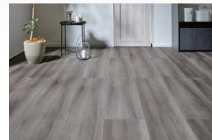
DL/ スモークオークF (ほんのり Foot feel)