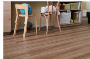
DY/ チェリーF (さらっと Foot feel)