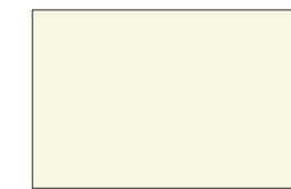
Y/ プレシヤスホワイト