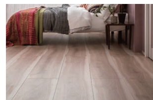
EA/ ワイドローズチェリーF (さらっと Foot feel)