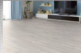
DX/ チェスナットF (しっかり Foot feel)