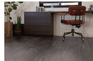
DZ/ ウォルナットF (ほんのり Foot feel)