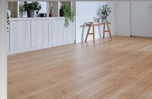
D2/ メープルF (さらっと Foot feel)