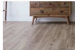
DB/ ラフオークF (しっかり Foot feel)