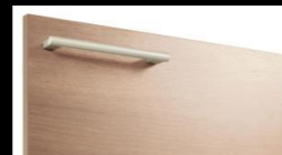
P: ミディアムウッドN