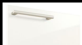
★W: パナシェホワイト