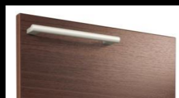
M: ロイヤルブラウン