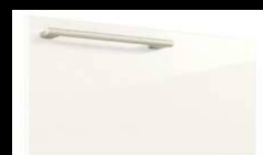
★W: パナシェホワイト