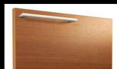
C: ロイディアムウッド