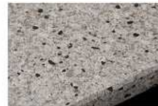
IZ:オリーブロッシュ