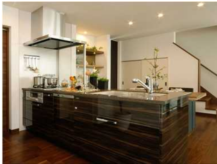
70キチネット : シンク位置 52cm : シンク横N : エンドパネル付き