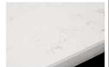
IY:ホワイトプラネット