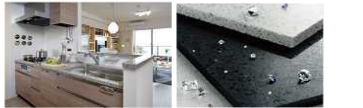
70アキビネット : シンク位置 52cm : シンク横N : エンドパネル付き