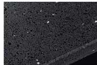
IQ:ジュエルブラック