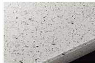
IS:ジュエルシルバー