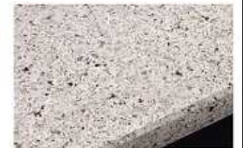
IR:クランベリーソルト