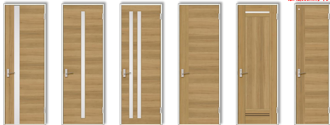
F-H3型 縦横木目 E-23型 横木目 E-25型 横木目 F-H1型 縦横木目 B-72型 框組 F-H2型 縦横木目 E-12型 横木目 アッシュ柄ホワイト色 E-12型 横木目 アッシュ柄ホワイト色